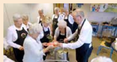
In de rij voor de bediening door 23 vrijwilligers.