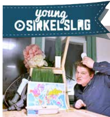
Sirkelslag 2016, Oude Kerk-jongeren

Jongeren uit heel Nederland gaan online de uitdaging aan op zoek naar de creatiefste, meest-buiten-de-kaders-denkende groep jongeren. Maar ook met kennis