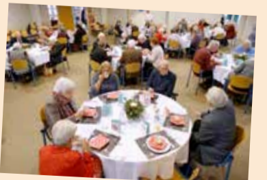
En zo zit iedereen aan de soep. Daarna volgt nog een heerlijke maaltijd en een mooie kerstviering.