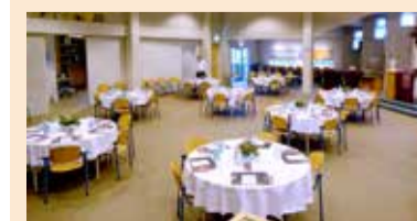
De Regenboogkerkzaal omgetoverd tot een restaurant voor 60 gasten.